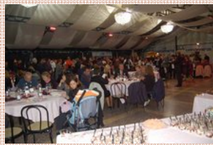
Alcune immagini della serata a Verbania

Ristoranti Sotto le stelle 15.09.2009 Tutto esaurito.. Per la prima edizione